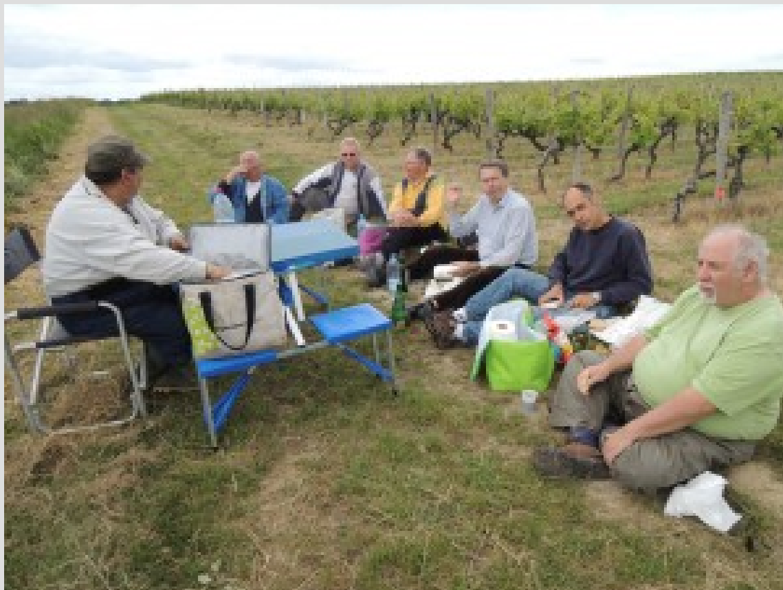
L'équipe au complet