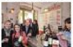
Les membres du club de Pompignac se réunissent pour une soirée de bienvenue.

19h Le club de Pompignac organise une soirée de bienvenue pour les nouveaux membres.