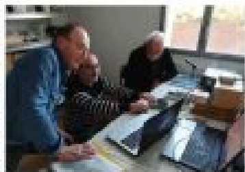
Les radioamateurs se réunissent régulièrement pour discuter de leur activité et partager leurs connaissances.

Le morse est une technique de communication qui consiste à transmettre des informations à l'aide de points et de traits. Cette technique a été inventée au début du XIXe siècle et a été utilisée pendant longtemps pour communiquer à distance. Elle est toujours utilisée aujourd'hui par les radioamateurs et les militaires.