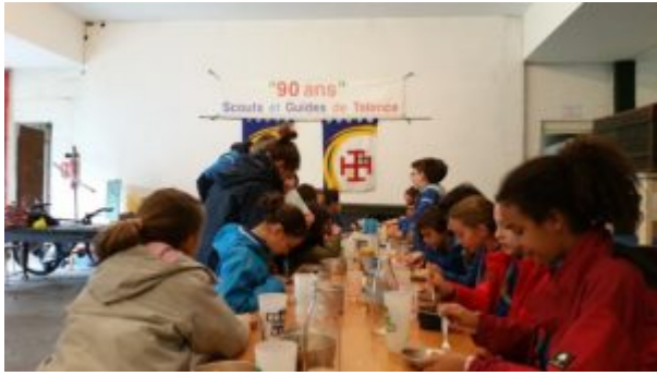
Le repas en commun